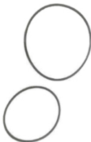
Anel de Vedação