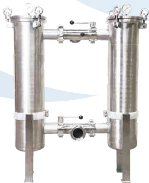
Filtro Bag Duplex