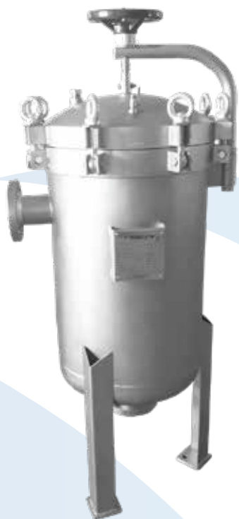
Filtro Multibag com Basculante Olhal