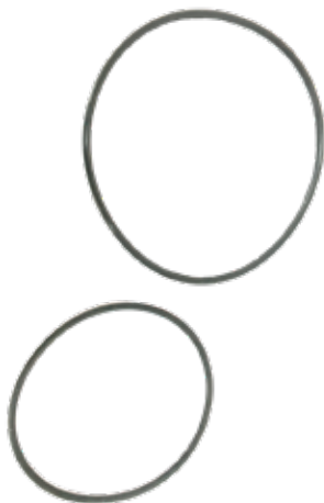
Anel de Vedação