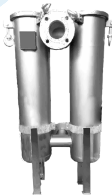
Filtro Bag Duplo